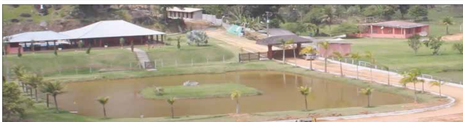
Fotos: Vereador Rafael Tubarão, Castelo de Itaipava onde foi realizado o seu casamento, e sua propriedade avaliada em dois milhões de reais.

Piabetá no município de Magé, que segundo alguns vizinhos do vereador a fazenda pode custar até dois milhões de reais, (R$ 2.000.000,00). E por fim, a transparência na administração do legislativo não é um forte do vereador, pesa também contra